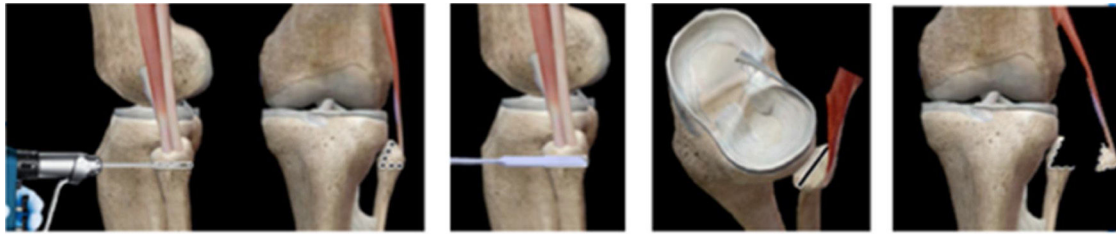
Figura 2 Esquema de la osteotomía modificada de la fíbula.

desprendiendo el tendón del bíceps femoral y la inserción del ligamento colateral lateral 13 . Por último, los abordajes con osteotomía de la cabeza de la fíbula parcial o total 14 , describen como complicaciones, dolor e inestabilidad lateral de rodilla.